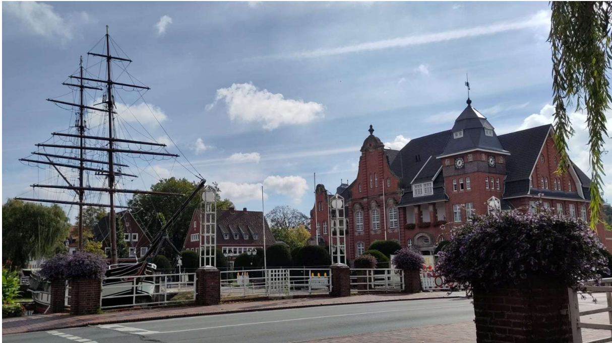
Das Rathaus von Papenburg

Im Preis ist das Buchweizenpfannkuchen und der Tee enthalten – (weitere Getränke zahlt bitte jeder für sich selbst).